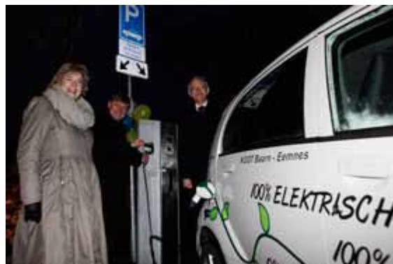
In gebruikname elektrische oplaadpunten in 2012

CO 2 is het belangrijkste broeikasgas dat bijdraagt aan de opwarming van de aarde. CO 2 komt vrij bij de verbranding van fossiele brandstoffen. Daarnaast zijn er nog andere broeikasgassen zoals methaan, lachgas en cfk's. Bij klimaatneutraliteit worden deze overige broeikasgassen ook meegenomen. In Laren en Blaricum richten we ons op CO 2 omdat dit het belangrijkste broeikasgas is en we ons daarnaast vooral willen voorbereiden op het opraken van de fossiele brandstoffen en het betaalbaar houden van de energievoorziening. Energieneutraliteit gaat nog wat verder dan CO 2 -neutraal. In dat geval moet alle duurzame energie ook daadwerkelijk binnen de gemeentegrenzen zijn opgewekt. Dit wordt niet haalbaar geacht. 2% is niet een hoge ambitie. Echter, makkelijke en goedkope maatregelen zijn vaak al toegepast. Voor een verdubbeling zijn vooral meer moeilijke en dure maatregelen nodig.