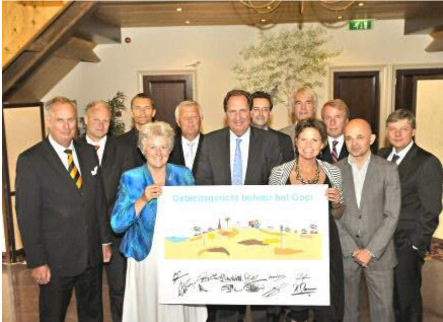
Ondertekening Convenant Gebiedsgericht Grondwaterbeheer het Gooi in 2011

Voor het MpGs 't Gooi is in 2005 al eerder een convenant afgesloten tussen gemeenten en de provincie. In 2011 is het nieuwe convenant gebiedsgericht beheer het Gooi (2012-2021) door betrokken partijen ondertekend. De beide gemeenten dragen jaarlijks financieel bij aan de uitvoering van het project. Er wordt deelgenomen aan de werkgroep die nadere invulling aan het convenant moet geven.